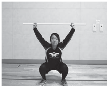
図 1 Deep squat (Ds)

7 種目の測定は、ポイント (0, 1, 2, 3) によって評価される。被検者が、測定中に、痛みがな