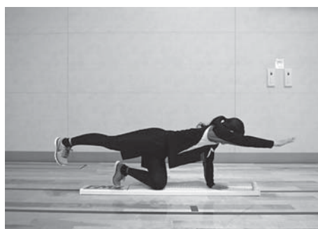
図7 Rotary stability (Rs)

く、制限なく指示される運動パターンを行うことができれば「3」、完全に実行できなければ「0」と、段階的にポイント化する。各テストで「0ポイント」の場合は、医師やトレーナーによるチェックを必要とする。「1ポイント」は、機能的なスタビリティやモビリティがないと判断する。さらに「2ポイント」の場合は、コンディショニングとストレッチが必要であり、「3ポイント」では最適なモビリティと柔軟性があると判断する。