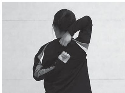
図 4 Shoulder mobility (Sm)