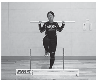
図 2 Hurdle step (Hs)