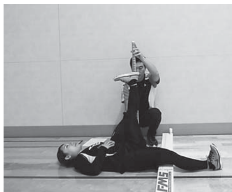
図5 Active straight leg raise (As)