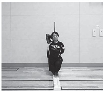
図 3 In-line lunge (Il)